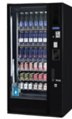
G-DRINK STANDARD VERTICAL DM9