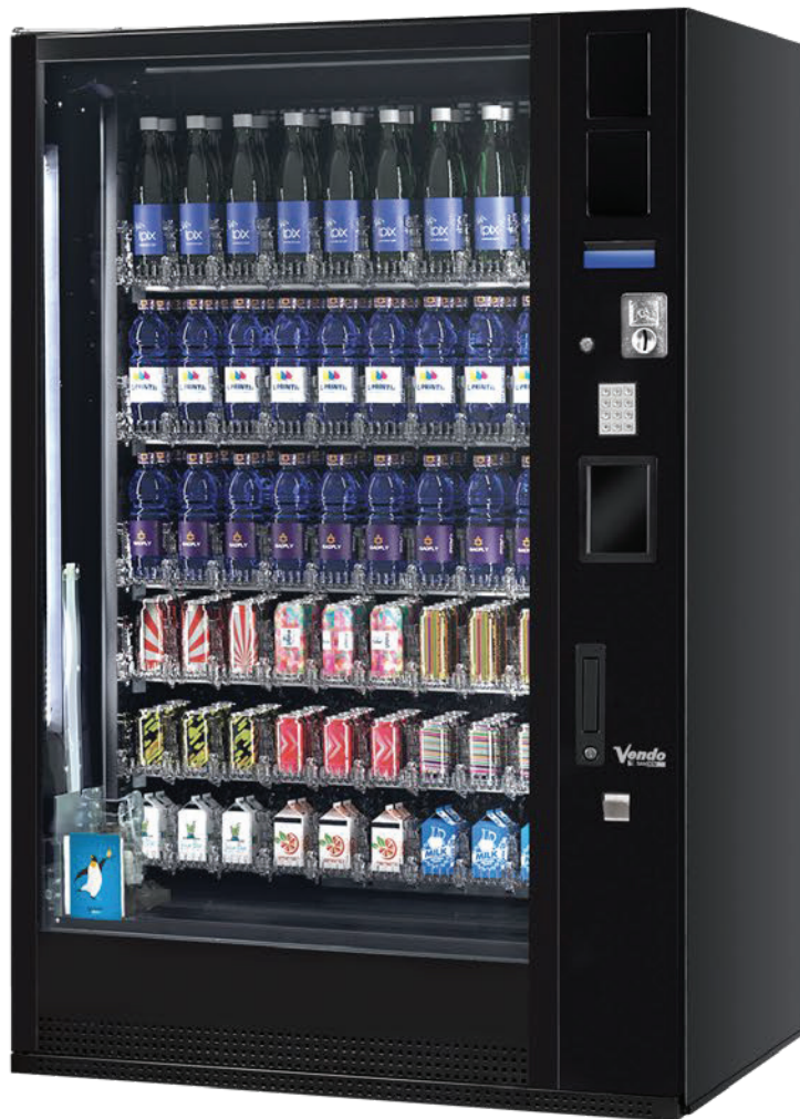
G-Drink DM 9 Vertical